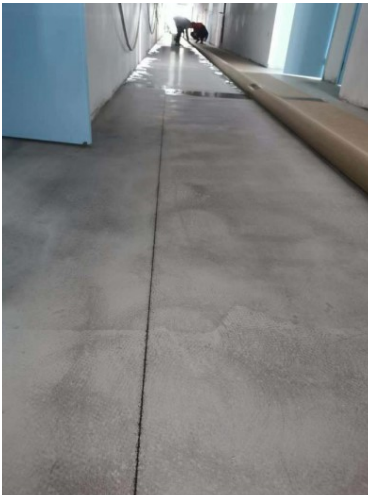
图8 第二实验楼亚麻地面施工

3. 外墙保温及真石漆完成约80%，室内亚麻地板施工完成约50%，北侧柱及门头装饰砖砌筑完成50%，室内机电安装工程完成约70%，正在进行设备安装。