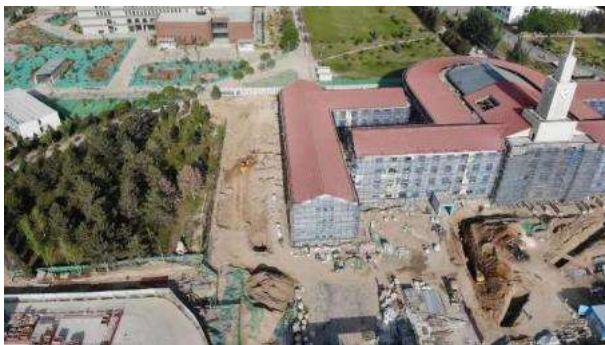
图1 综合楼外立面石材幕墙施工

1.完成玻璃采光顶安装，石材幕墙正在施工；完成北侧、西侧道路施工，正在进行南侧道路施工。