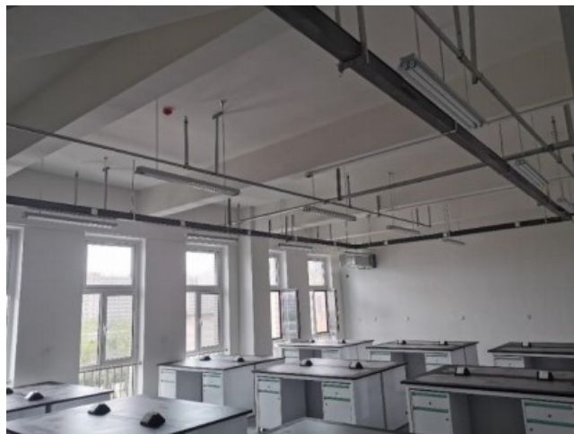
图7 第二实验楼已移交房间设备安装