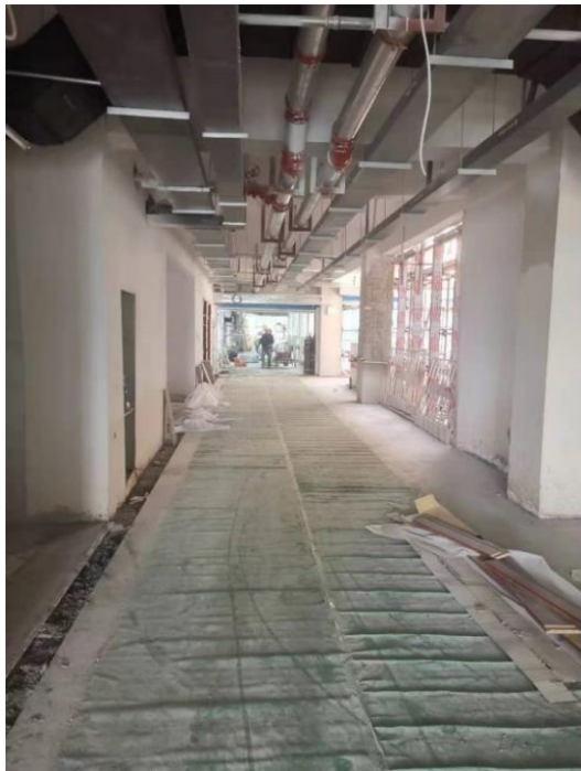
图3 综合楼室内完成地砖保护

2. 室内地砖铺贴完成90%，水磨石地面完成约80%，楼梯间水磨石正在打磨，3-4层乳胶漆施工完成90%，完成照明配管配线。