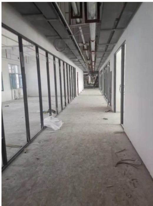
图5 综合楼室内玻璃隔断龙骨安装