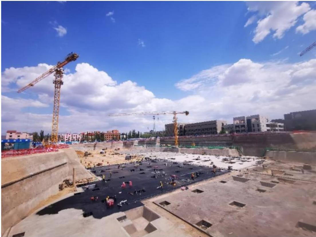
图9 人文社科组团I项目垫层及防水施工