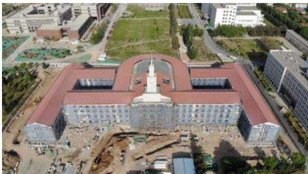
图2 综合楼南侧道路及东侧雨污水施工