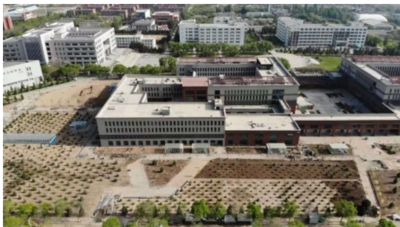
图6 第二实验楼室外铺装及绿化施工

1.完成南侧、西南侧种植，正在进行西北角种植场地平整及种植土换填；完成东侧铺装及绿化施工，完成南侧及西侧垫层施工，完成西侧马路水稳层施工。